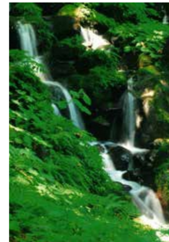
毛勝の郷シェルピースから5.5km

沌滝は、片貝川支流の溪流が、岩苔の鮮やかな緑の中を流れ、3段約25メートルの段瀑（段々に別れて落下する滝）で周囲の緑に囲まれた優しげな滝。