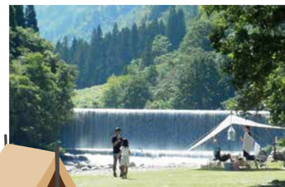
毛勝の郷シェルピースから 5.7km