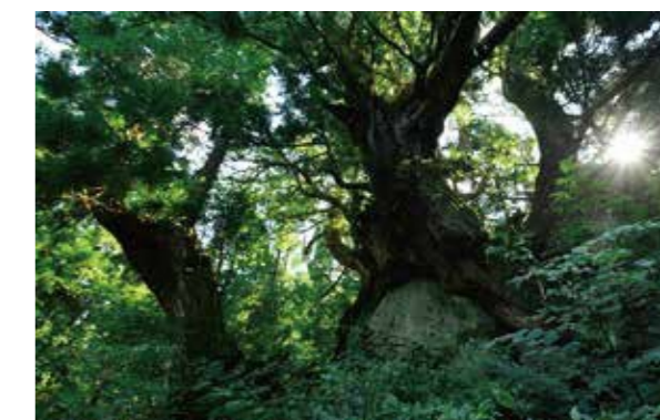
毛勝の郷シェルピースから 13.1km