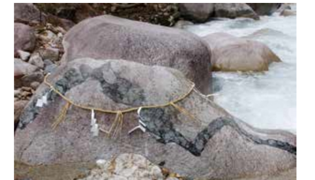
毛勝の郷シェルピースから11.7km

古来からこの石を叩けば雷雨になると信じられ、毎年5月中旬には、雨乞いの神事が行われている。